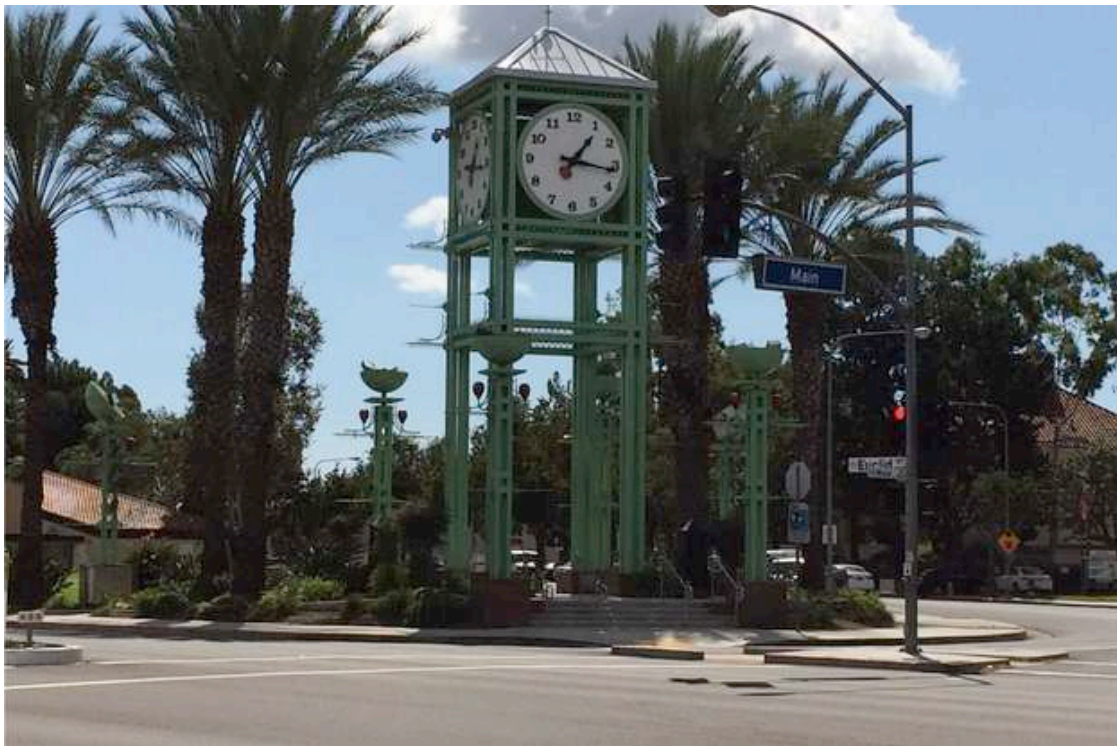
Jam Besar di Taman atau Pedestrian yang Iconic

Taman atau pedestrian tersebut akan terlihat indah dipandang dengan ditambah ornamen Jam Besar yang bisa memberikan warna lain untuk keindahan dan manfaat lebih kepada masyarakat yang melintasi taman tersebut.