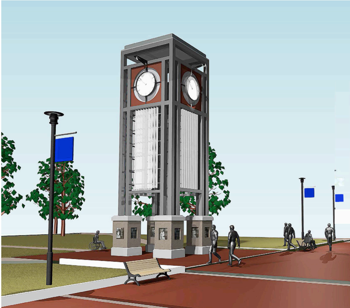
Outdoor Clock GF200 - Jam Taman Kota

Giant Face clocks ini adalah jenis jam besar outdoor dibuat dengan custom made dan hand made dengan desain yang iconic sesuai dengan permintaan, sehingga sifat unik dapat dibuat dengan ukuran besar.